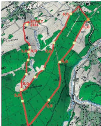
Streckenführung 10 km-Lauf